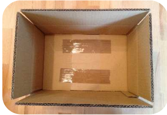
... Boden-Versteifungs-Pappstreifen mit Klebeband fixieren