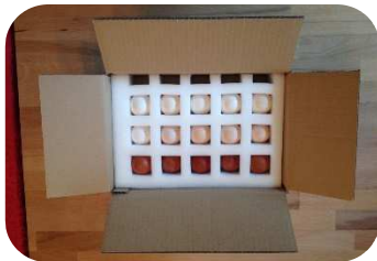
Bruteier ins Gefache einlegen