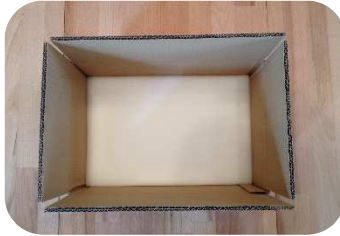
Schaumstoffunterlage auf Kartonboden einlegen