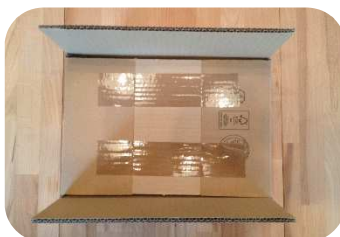
...und mit Klebeband fixieren