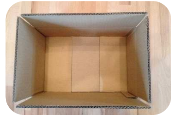
...zwischen die schmalen Bodenklappen einlegen...