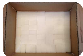
VPE 3 und VPE 4: untere Abpolsterung m. Schaumstoff-Aussparungswürfel 35 x 35 mm, Bei VPE 14: Würfel - 43 x 43 mm

Bei mehrlagiger Gefache-Anordnung unbedingt auf die Drehung des oberen Gefaches in Längs- als auch in Querrichtung achten, sodass sich mittig unter jeder Aussparung die darunterliegenden Schaumstoffstege kreuzen!