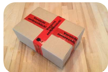
Deckelklappen schließen und Paket allseitig über Kreuz mit Paket-Klebeband verkleben