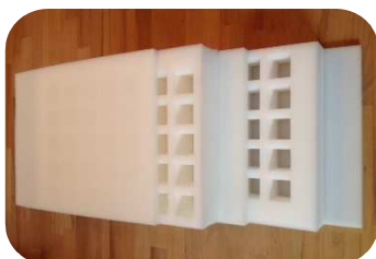
Mehrlagige Anordnung der Gefache jeweils auch mit Schaumstoffzwischenlage!!