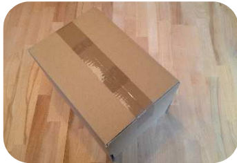
Faltkarton zusammenfügen und Boden außen mit Klebeband fixieren