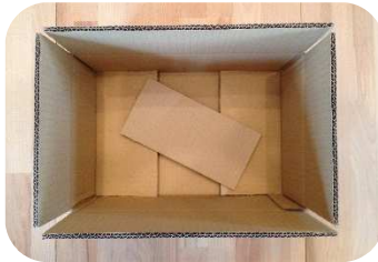
innere Bodenversteifung mittels Pappstreifen...