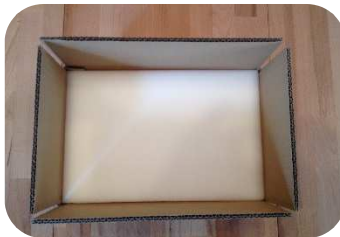
obere Schaumstoff-Polstermatte einlegen