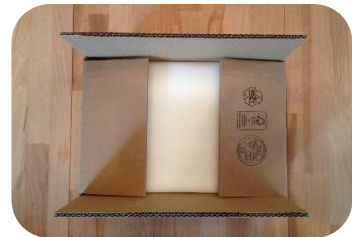
schmale Deckelklappen schließen